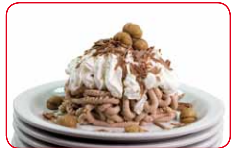
Eiskreation mit dem Formeinsatz "Spaghetti"