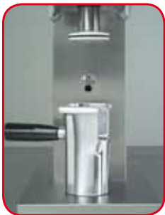
Formeinsätze aus Aluminium Anticorodal. Spaghettiform serienmäßig