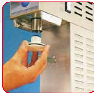
Der Druckkolben aus Makrolon® ist einfach zu entfernen für eine perfekte Reinigung